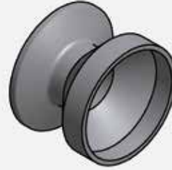
CONCENTRIC REDUCERS WITH FERRULE KONZENTRISCHE REDUZIERUNGEN MIT STUTZEN