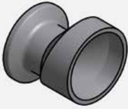
EXCENTRIC REDUCERS WITH FERRULE EXZENTRISCHE REDUZIERUNGEN MIT STUTZEN